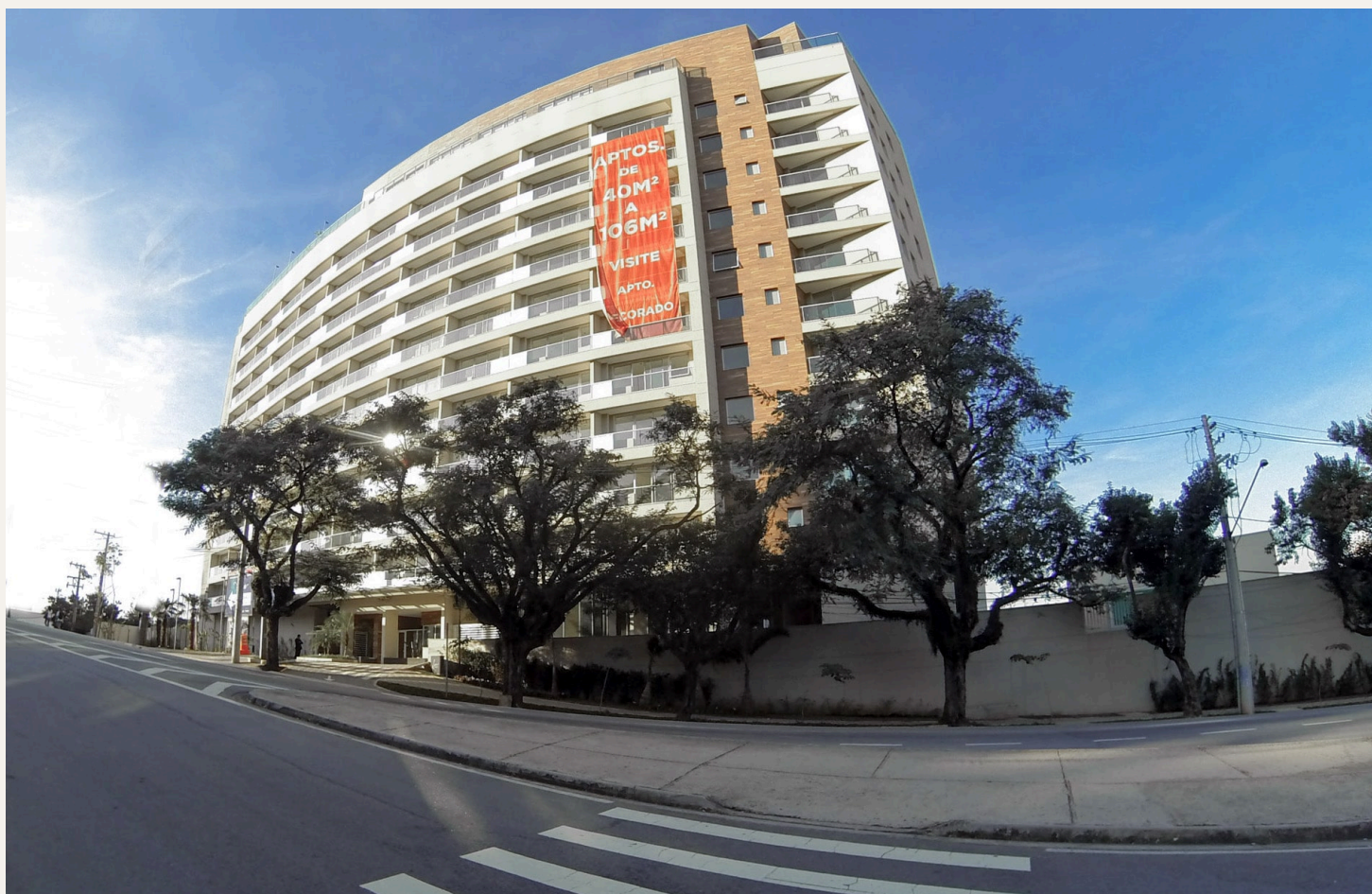
ILUSTRAÇÃO: LÍNEA HOME STYLE

O que começou como um teste virou um caso de sucesso, mostrando que informação bem apresentada fortalece a confiança, valoriza a gestão e dá voz à comunidade.