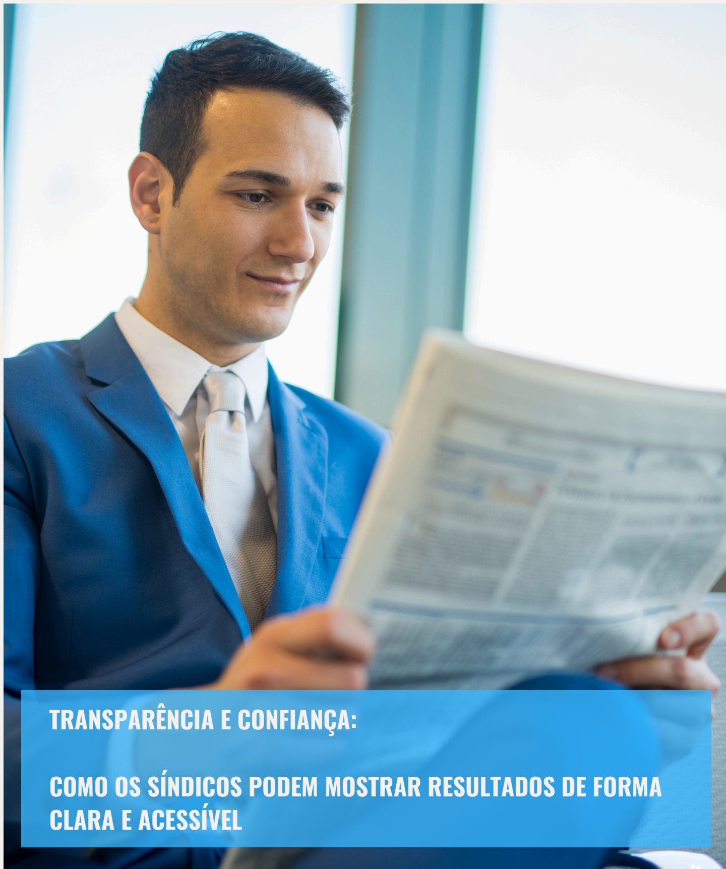
ILUSTRAÇÃO: TRANSPARÊNCIA E RESULTADOS