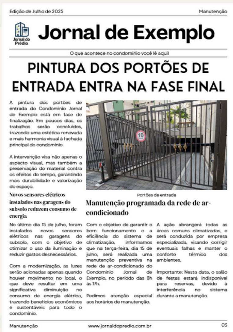
ILUSTRAÇÃO: JORNAL DE EXEMPLO