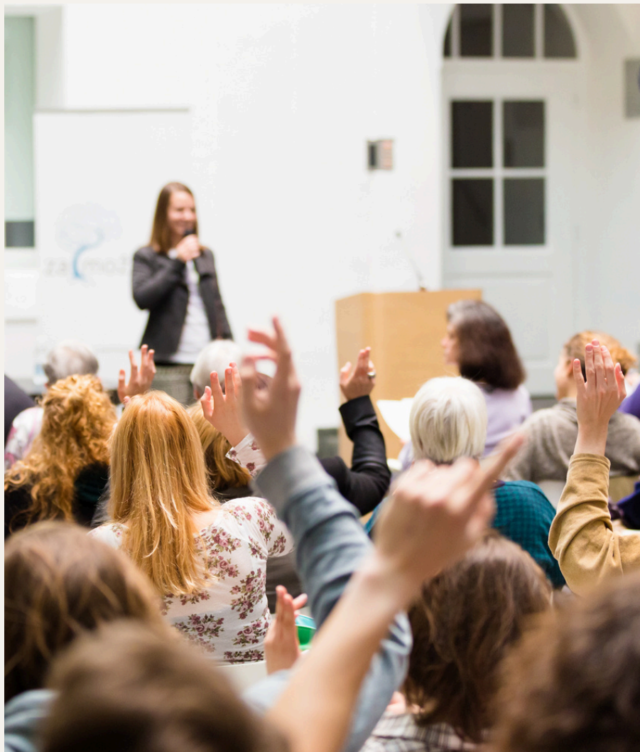
ILUSTRAÇÃO: CONVIVÊNCIA E COMUNIDADE

O jornal também funciona como vitrine para as conquistas do condomínio. Reformas concluídas, melhorias nas áreas comuns, iniciativas sustentáveis ou campanhas internas ganham destaque de forma organizada e acessível.