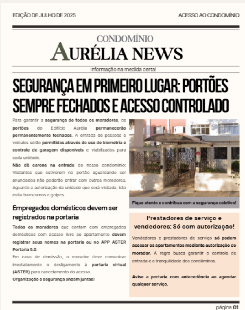
ILUSTRAÇÃO: AURÉLIA NEWS

Fotos de melhorias, registros de eventos, comunicados e até lembretes de convivência ganham outra dimensão quando apresentados em um formato bonito e profissional. Afinal, quando o jornalzinho parece um material de revista, os condôminos se