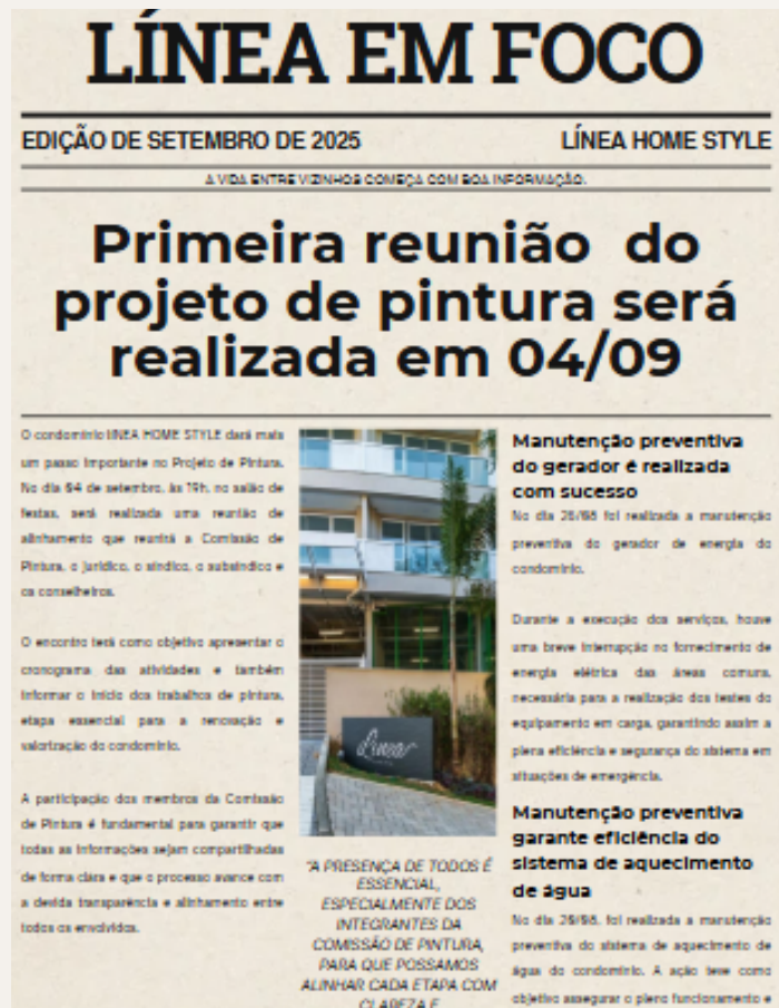
ILUSTRAÇÃO: JORNAL LÍNEA EM FOCO

Desde a primeira gestão do condomínio Línea Home Style, a comunicação com os moradores sempre foi um tema delicado. Muitas vezes, os condôminos não tinham clareza sobre o que estava acontecendo no prédio, quais melhorias estavam em andamento ou de que forma a administração atuava. Essa falta de informação acabava gerando cobranças, dúvidas e até desconfiança.